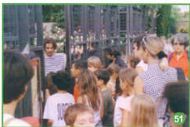
Il y a aura de la place pour tout le monde...