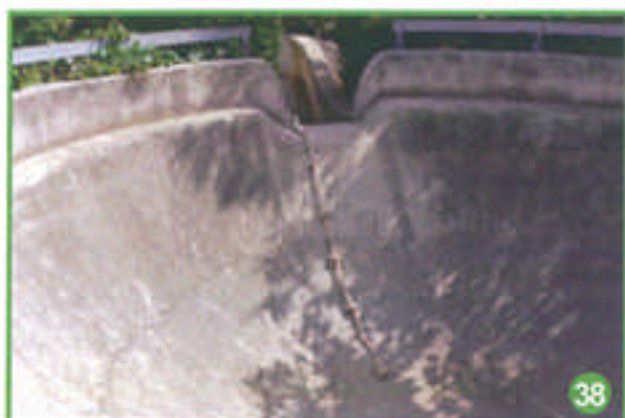
Heureusement qu'il y a une corde à nœuds pour sortir de ce trou.