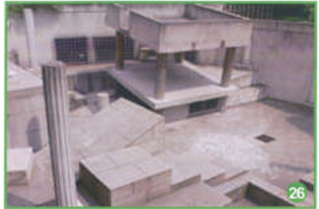
pour découvrir la Cité interdite,