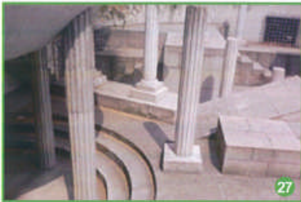
ses ruines mystérieuses,