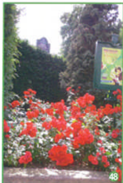
Tout le jardin est orné de fleurs, de plantes et d'arbres de toute sorte,