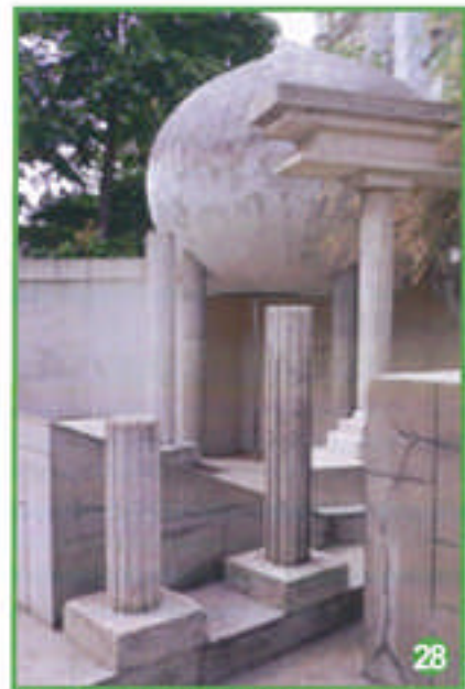
ses colonnes d'un autre âge,