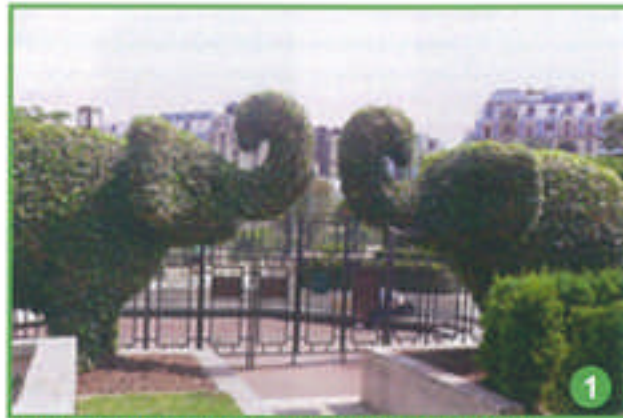
Quand vous serez passé sous l'entrée des éléphants...