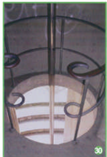
avec un moyen pratique pour s'enfuir en cas de danger