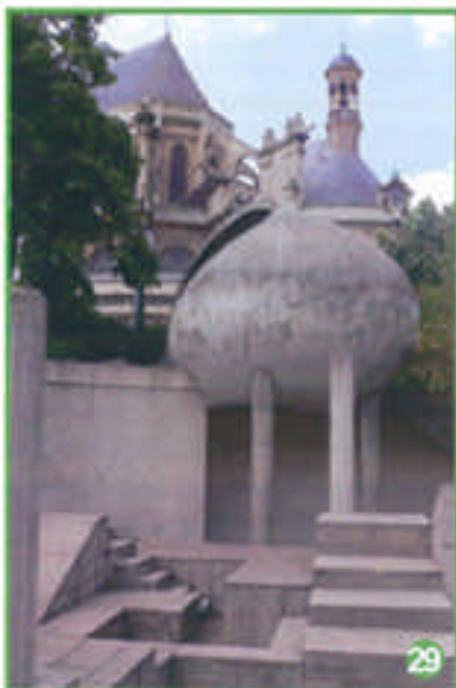
son drôle d'abri en forme de coquillage,