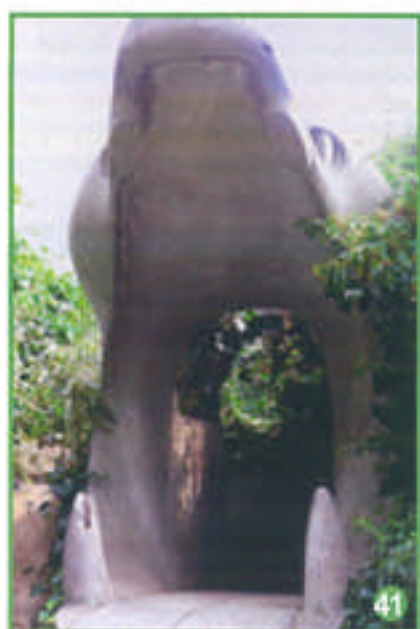
Amateurs de sensations fortes, approchez !