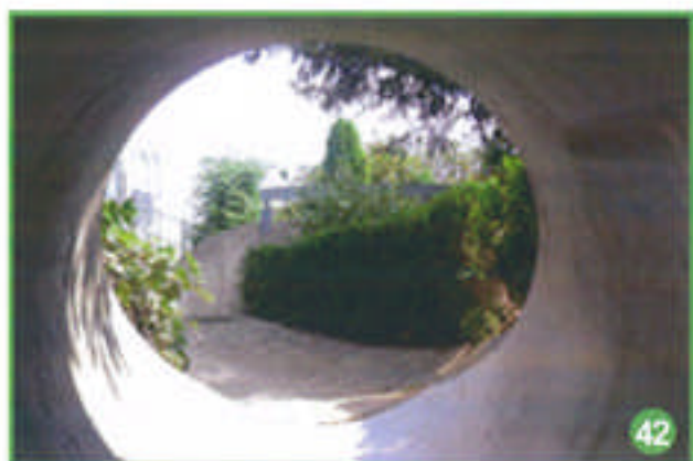
Cela fait du bien de retrouver la lumière !