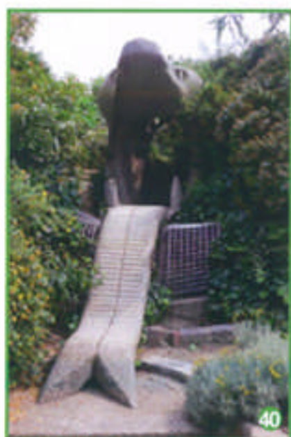
Ou à l'intérieur de cet énorme serpent ?