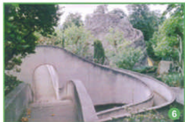
de drôles de circuits ... qui vous mèneront dans 6 mondes magiques.