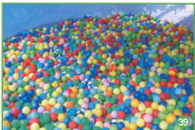
Un petit plongeon dans la piscine à boules ?