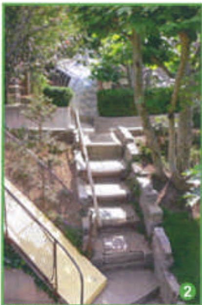
de multiples chemins s'offriront à vous,