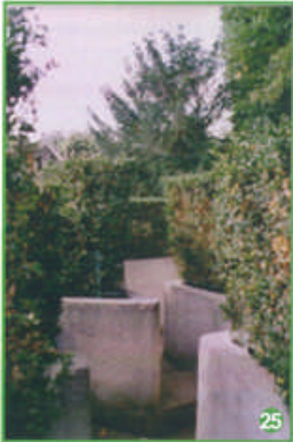
On emprunte ensuite un labyrinthe...