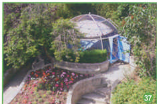
Voici enfin le monde mou.