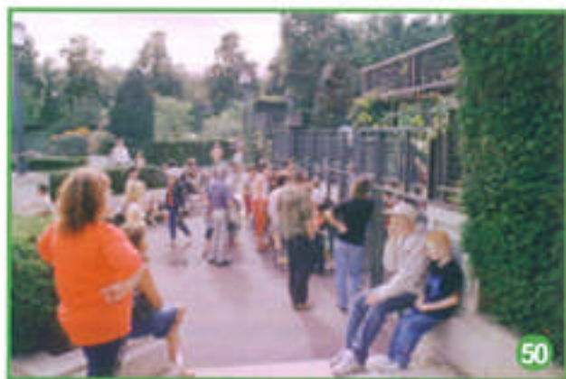
Tout est prêt, vous pouvez venir jouer, les enfants !