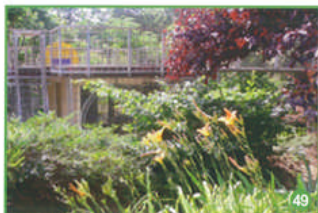
comme un vrai parc !