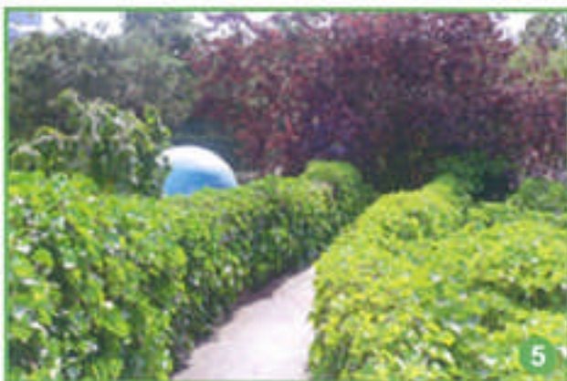
un pont couvert de lierre,