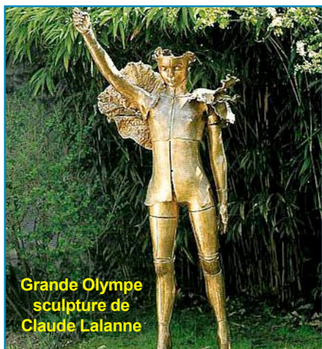
Grande Olympe sculpture de Claude Lalanne