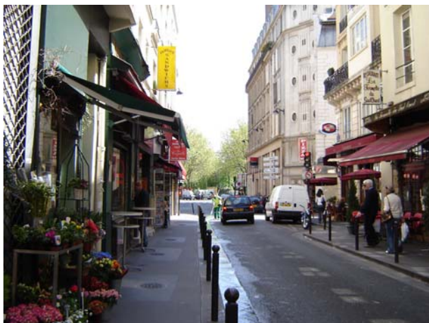
La rue Coquillière, en direction des Halles