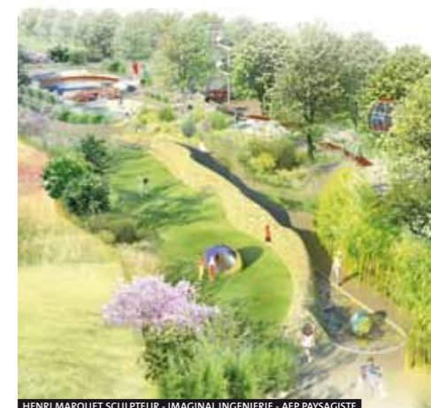
HENRI MARQUET SCULPTEUR - IMAGINAL INGENIERIE - AEP PAYSAGISTE

Les travaux d'aménagement de l'aire de jeux de 2 500 m 2 pour les enfants de 7 à 12 ans ont repris et vont se poursuivre jusqu'à sa livraison prévue en fin d'année 2011.