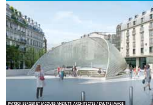
PATRICK BERGER ET JACQUES ANZIUTTI ARCHITECTES

Ci-dessous le nouvel accès à la gare sur la place Marguerite de Navarre.