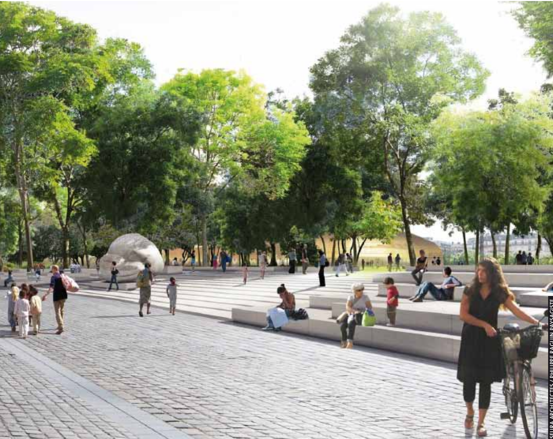
SEURA ARCHITECTES / PHILIPPE RAGUIN PAYSAGISTE

Le 18 août et le 25 octobre, le juge des référés a rendu deux ordonnances rejetant des demandes de suspension du permis de démolir du jardin. Il a estimé que l'exécution du permis de démolir n'avait pas lieu d'être suspendue, « aucun des arguments invoqués n'étant de nature à faire naître un doute sérieux quant à la légalité de la décision attaquée ». Les travaux dans le jardin, partie intégrante du vaste projet de réaménagement des Halles, ont donc pu reprendre dès le 18 août avec la démolition des pergolas situées le long de la rue Berger.