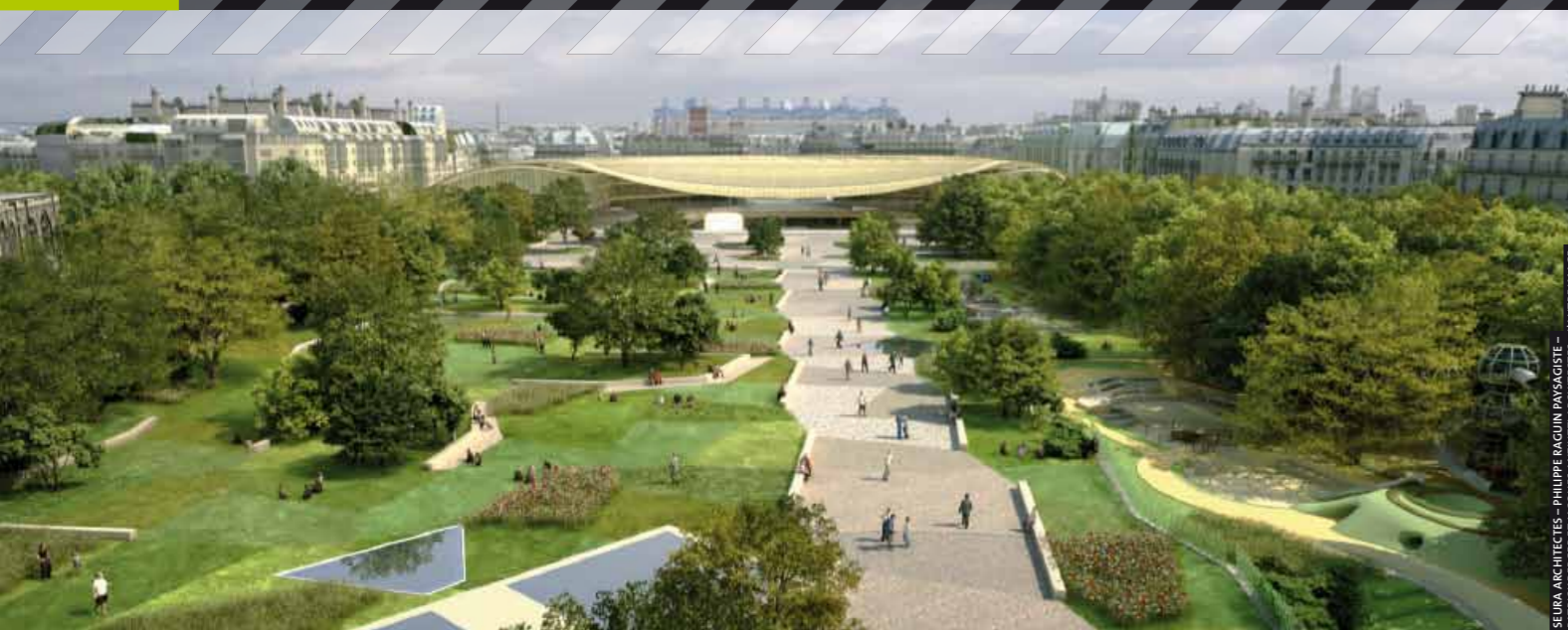
SEURA ARCHITECTES - PHILIPPE RAGUIN PAYSAGISTE - PATRICK BERGER ET JACQUES ANZIUTTI ARCHITECTES - LAUTREIMAGE