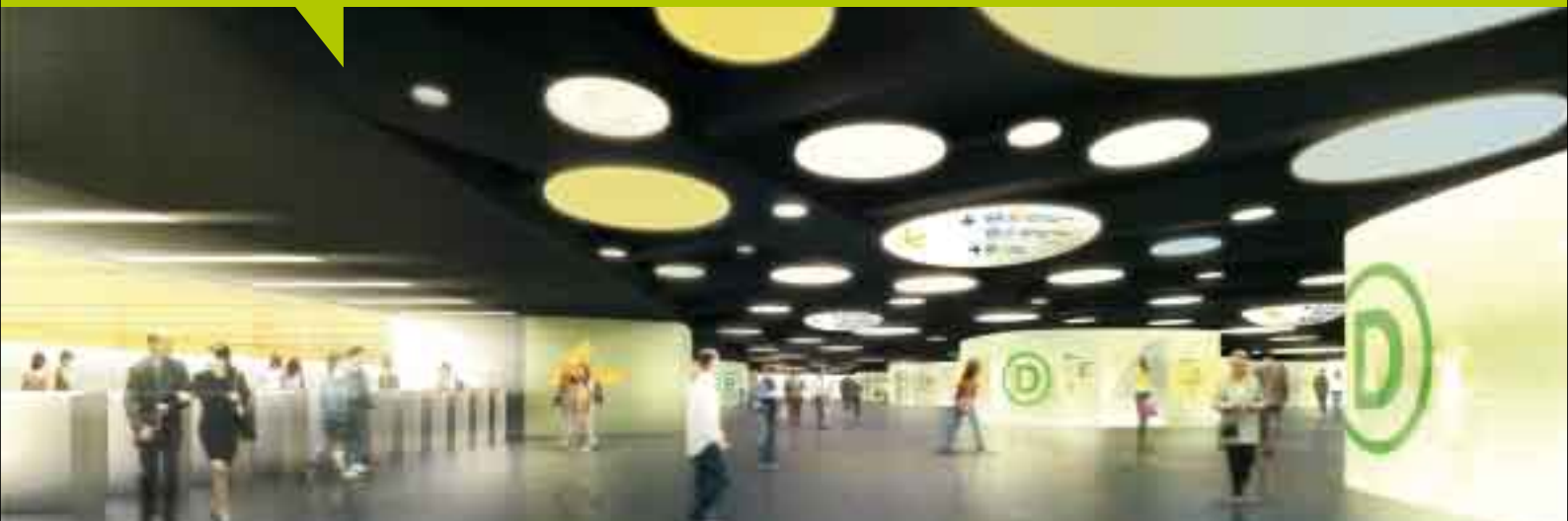
Patrick Berger et Jacques Anziutti architectes / Perspective: studiosezz / Maitrise d'ouvrage : RATP

Cette réorganisation spatiale, crée aussi de nouveaux repères. Elle rend lisible la relation entre les espaces souterrains et la surface, permettant aux voyageurs de mieux se situer dans leurs cheminements.