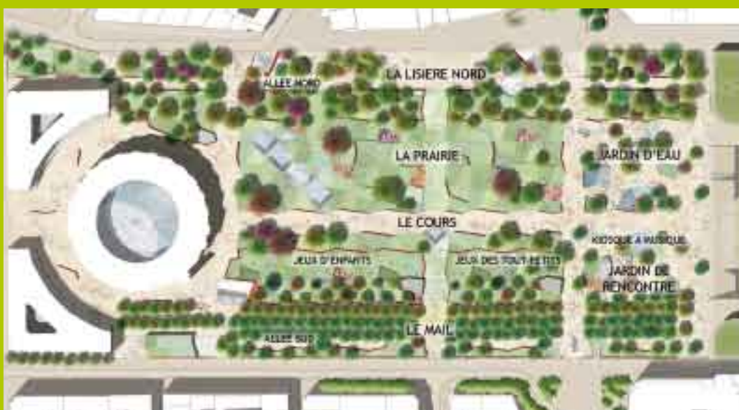
SEURA / David Mangin architectes

plus ouvert, accessible à tous, plus sûr, de plain-pied et aux usages multiples