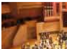
LE CONSERVATOIRE ET LA BIBLIOTHÈQUE : DES ÉQUIPEMENTS VALORISÉS ET ÉTENDUS