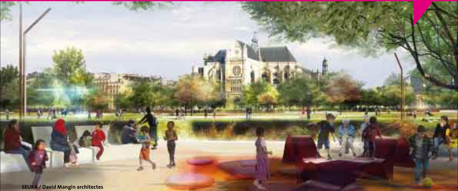
SEURA / David Mangin architectes

permettant à chacun de trouver sa place. La relation forte entre le jardin et la Canopée se traduit par un accès magistral vers le patio du nouveau Forum. Une meilleure insertion des voiries souterraines permettra d'étendre le secteur piétonnier en périphérie du jardin : rues Coquillière, Berger, des Prouvaires, Sauval, Vauvilliers et du Pont-Neuf et jusqu'au carrefour de la rue de Rivoli.