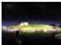
LA CANOPÉE : LA FONCTION ET LE SYMBOLE