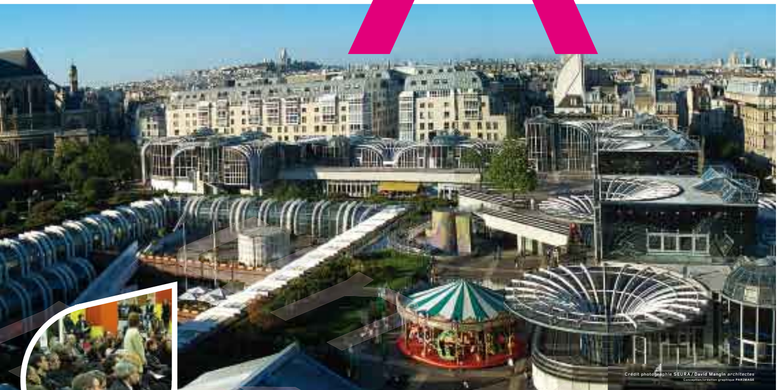
Crédit photographie SEURA/ David Mangin architectes Conception/ création graphique PARMAGE