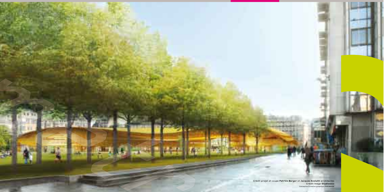
Crédit projet et coupe Patrick Berger et Jacques Anselotti architectes Conception/creation graphique PARIAGE