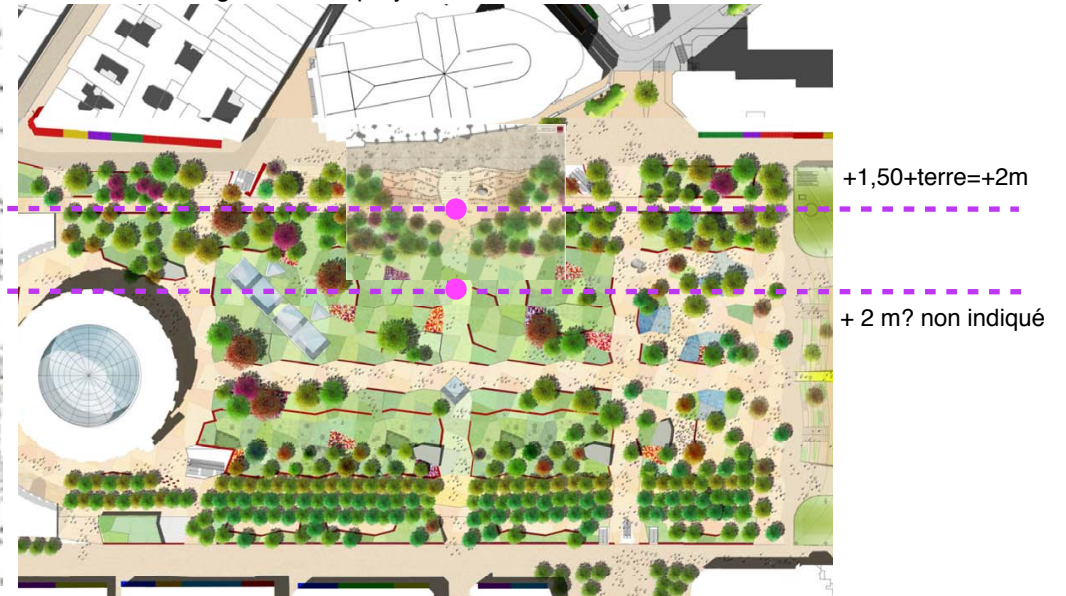
fig4 Niveaux projet SEURA 2010 var2