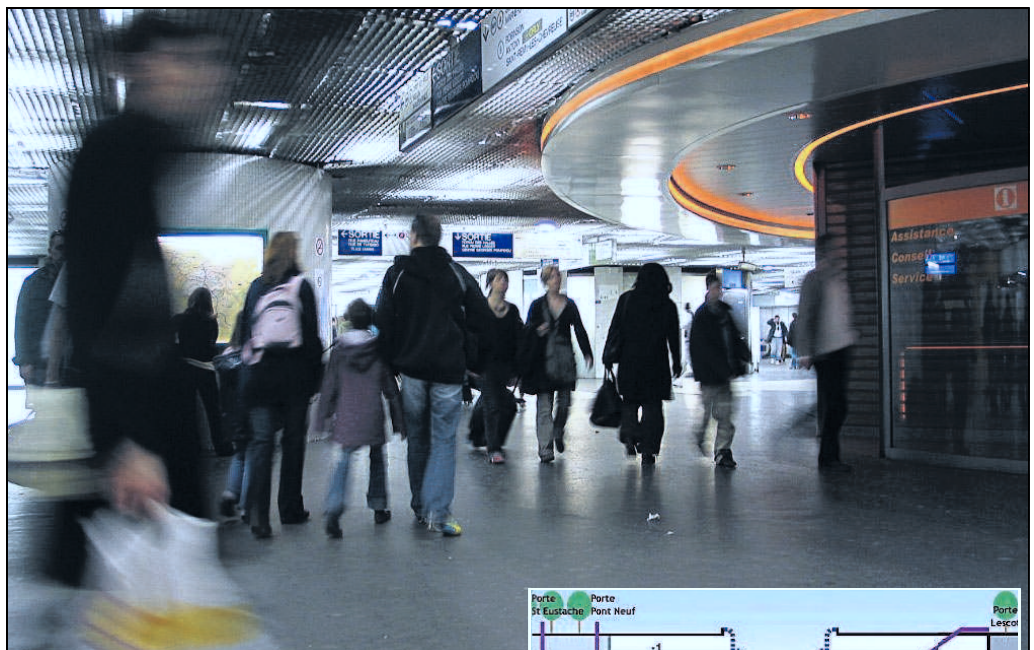
CHATELET-LES HALLES (1 er ), HIER. La salle des échanges a été construite en 1977 sous le forum. Elle ne dispose pas d'accès direct débouchant sur la rue (infographie ci-contre).

■ Sortir du labyrinthe de la salle des échanges. On l'appelle le flipper. Parce qu'elle est remplie de gros piliers cylindriques et que les voyageurs perdus rebondissent de l'un à l'autre sans trouver leur route. La salle des échanges du RER, c'est le point noir du pôle Châtelet-les Halles. Basse de plafond, traversée chaque jour par 423 000 personnes, elle ressemble à un véritable labyrinthe pour tout voyageur non initié. Le projet soumis au