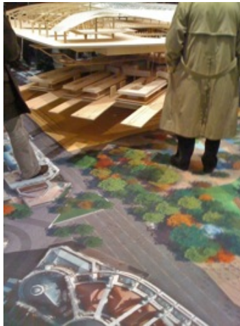
"Vue depuis Saint-Eustache" - La photo aérienne de Paris reproduite sur le sol permet de se représenter l'insertion du projet.