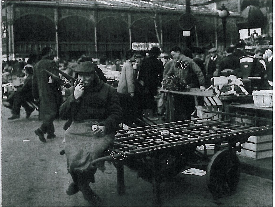
Dort, wo einst die Markthallen standen, soll bald ein grüner Teppich (Simulation, kl. Foto) Paris beleben.

Wie schon so oft in der Geschichte von Paris wird das Hallenviertel zum Schauplatz urbaner Metamorphosen, an dem der planende Wille der Herrschenden und das Chaos des Alltags aufeinander-