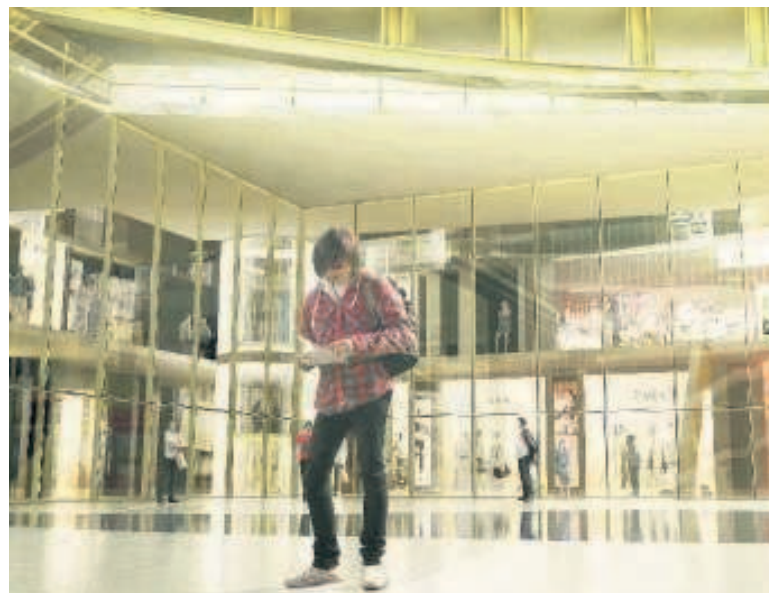
Le consortium constitué par Unibail-Rodamco et Axa doit verser 238 M€ à la Ville de Paris, soit environ un tiers de l'investissement prévu pour la rénovation des Halles.