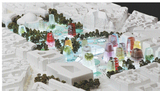
Projet Rem Koolhaas*

et de gratuité du jardin, l'animation commerciale du Forum, l'équipe OMA / Koolhaas creuse un énorme canyon jusqu'au niveau - 4 au beau milieu du jardin, et plante dans les pelouses actuelles des tours de verre abritant des commerces.