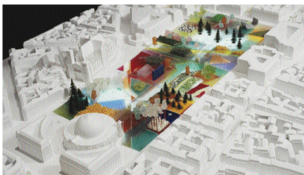
Projet Winy Maas*

En revanche, nous avons été déçus par les autres projets, car nous constatons qu'ils n'ont pas pris en compte avec la même attention nos propositions. Par exemple, alors que nous nous étions déjà opposés à cette hypothèse, l'équipe MVRDV / Maas surélève l'ensemble du jardin sur un podium de verre qui transformera les rues Berger, Lescot, Rambuteau et Coquillière en corridors sans plus aucune perspective sur le jardin ni sur Saint-Eustache. Alors que nous nous étions opposés à toute rupture de la séparation dessus-dessous qui conduise à déverser, dans l'espace de calme