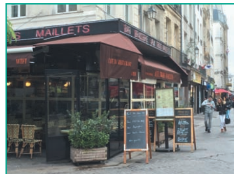
Pour mémoire, les chevalets à l'extérieur d'une terrasse sont interdits. Il n'y a pas un mais quatre !