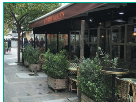
Deux arbres coupés pour permettre d'agrandir la terrasse !