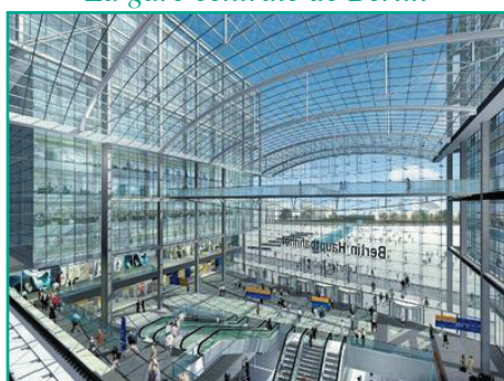
La gare centrale de Berlin