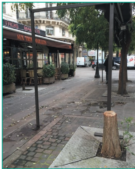
Arbre coupé pour la terrasse d'été du café d'en face

*pour information, les autorisations de terrasses accordées par la Direction de l'Urbanisme sont consultables en ligne.